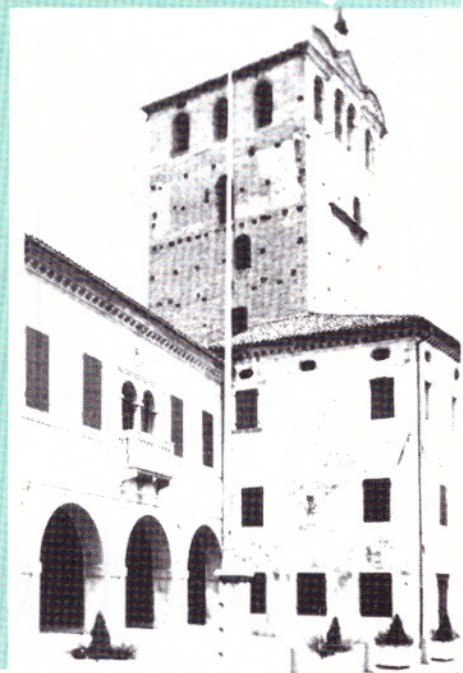
Fontego e Torre

Finché la giurisdizione si estendeva dal fiume Livenza al Lia, nel porto si commerciavano svariate mercanzie, sul Livenza si fluitava il legname, la floridezza economica era assicurata anche perché era indispensabile fare capo a Portobuffolè per recarsi in Friuli. Ancora visibili sono la settecentesca Porta Friuli dominata dal leone di San Marco, e il luogo dove sorgeva Porta Treviso, abbattuta dopo la prima guerra mondiale.