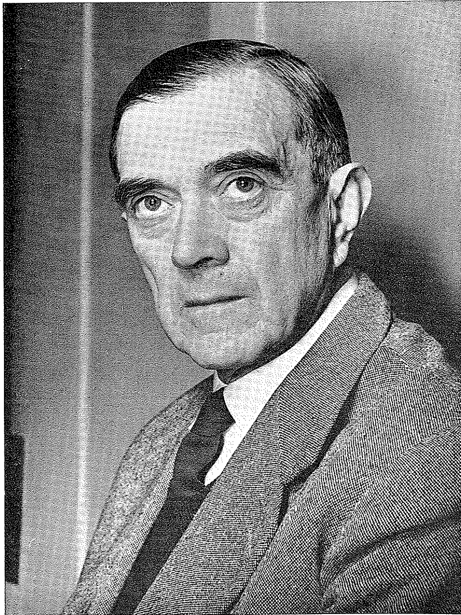
CORRADO GINI 1884-1965