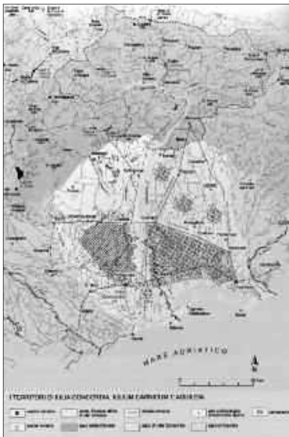
Fig. 6. Carta dei territori di Iulia Concordia , Iulium Carnicum e Aquileia (da Tagliamento 2006, p. 303).

grante della successiva centuriazione concordiese, per la quale sembra aver avuto la funzione di asse di riferimento, ed anche in quanto percorso condotto tra risorgive e magredi, tra centuriazione e area esclusa dalla pianificazione, a costituire una sorta di cerniera tra due forme di economie, quella agricola e quella pastorale. Da questo punto di vista, credo che uno studio complessivo della viabilità e degli insediamenti nella media e alta pianura friulana potrebbe apportare elementi molto interessanti per una ridefinizione dell'utilizzo delle risorse del terri-