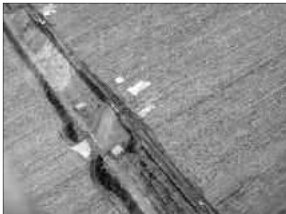
Fig. 8. La via Annia presso la località Malisana. In alto, a sinistra, sono visibili i fossi laterali che corrono parallelamente alla via, individuabile verso il centro della foto.

dell'assetto fondiario. Da questo punto di vista non sono mancati gli elementi degni di nota e interesse. In primo luogo, l'andamento di queste delimitazioni appare del tutto autonomo (44° ovest) rispetto a quello dell'orientamento della centuriazione aquileiese (22° ovest), legandosi invece al riferimento costituito dalla via. In secondo luogo, i fossi mostrano di essere stati riattivati in età postantica e di essere rimasti in uso forse fino agli inizi del Novecento. Questo dato invita ad alcune riflessioni sulla persistenza dell'influenza dell'assetto agrario antico e dell'asse viario dell'Annia – forse anche per quanto riguarda la conservazione della sua funzione? – sulle suddivisioni agrarie moderne 52 .