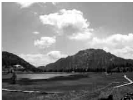
Fig. 11. L'area del passo di Pramollo.

Legati a questi ultimi aspetti vi sono alcuni temi che finora sono stati affrontati solo marginalmente dagli studiosi, quali quelli del sistema di comunicazioni nell'area alpina orientale, sia per quanto riguarda le principali arterie di traffico sia a proposito della rete di piste, sentieri e percorsi secondari, dell'uso dell'alpeggio, della transumanza su ampia scala tra ambito alpino e bassa pianura. Non che manchino studi specifici; basti pensare alle indagini relative al percorso diretto al Norico attraverso il passo di Monte Croce Carnico, con la sua straordinaria documentazione epigrafica 58 , o agli studi condotti in anni recenti sui percorsi della transumanza o sulla rete dei percorsi vallivi 59 , ma in questa direzione, più che altrove, mi pare che vi possano essere ampi margini per la ricerca attuale e futura. Per fare un semplice esempio, col quale concludo questa panoramica, nel corso di alcune campagne estive condotte recentemente in condizioni di assoluta economia nell'area del passo di Pramollo (fig. 11), a immediato ridosso