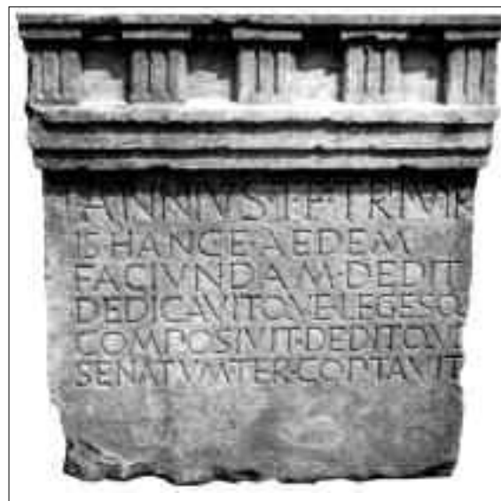
Fig. 2. Iscrizione relativa agli interventi compiuti da T. Annio, uno dei triumviri incaricati del supplementum aquileiese del 169 a.C. (da LETTICH 2003, p. 34).

problemi connessi alla dominante presenza delle acque. Non a caso, le indagini condotte a Cà Tron hanno portato alla luce l'esistenza di due percorsi, l'uno più basso e antico, l'altro realizzato successivamente a monte del primo che si era rivelato soggetto al rischio di impaludamento 18 . Si è così ricostruito un momento importante della via, sintomatico dell'attenzione romana all'efficienza della rete della viabilità. Tra le altre cose, si è potuto studiare la tecnica costruttiva adottata nella realizzazione di una struttura mista, costituita da un guado e da un ponte per il superamento di un piccolo corso d'acqua, l'odierno Canna 19 . Inoltre, grazie all'estensione delle indagini di superficie e dei saggi di scavo, e al ricorso alle analisi paleobotaniche e palinologiche, si è potuto ricostruire il paesaggio attraversato dalla strada nella sua evoluzione e, dunque, anche il rapporto tra strada e territorio, con il succedersi degli impianti e degli assetti agra-