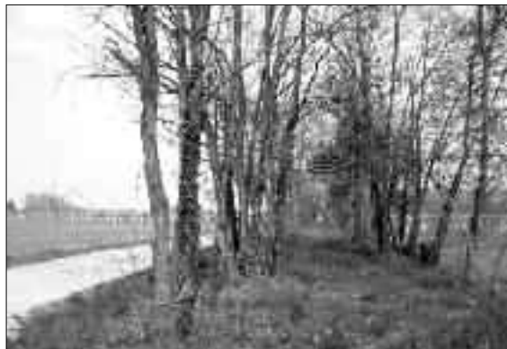
Fig. 5. Tratto del decumano della centuriazione concordiese, probabilmente identificabile con la via Postumia. È ben visibile l'ampio terrapieno su cui correva la strada.

Alcune indagini recenti inducono a rivalutare l'idea espressa da Tagliaferri 50 . La via Postumia pare inserirsi in un compiuto sistema di organizzazione territoriale, come parte inte-