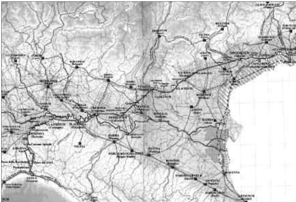
Fig. 1. Viabilità e insediamenti di età romana in Italia settentrionale (da Tesori della Postumia 1998b, pp. 14-15).

delle successive centuriazioni o via di collegamento trasversale, essa costituì in un primo momento lo straordinario settore terminale di un vero e proprio sistema di strade volto al controllo del territorio italico e costituito dalla via Flaminia e dalla via Emilia, di cui la Postumia era la logica prosecuzione. In seguito, essa funse soprattutto da base di partenza per le direttrici di comunicazione che dai centri dell'Italia settentrionale portavano alle regioni transalpine, prima di perdere funzionalità nella sua interezza, in età imperiale, a vantaggio di un nuovo sistema che ne inglobò comunque numerosi tratti, alcuni dei quali ancora oggi in funzione 9 .