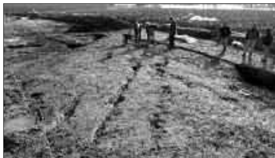
Fig. 7. La via Annia presso la località Malisana. Sono visibili, oltre ai solchi carrai, i fossati di scolo laterali.

Lo scavo di Cà Tron e le ricerche condotte dagli studiosi della scuola padovana hanno contribuito a fare luce sulla realizzazione della via Annia, sulle modalità di intervento in territori umidi e sulle forme di occupazione del territorio e di integrazione tra viabilità e sfruttamento agricolo, ma non sono mancate anche in Friuli indagini recenti sulla stessa via. Nel 2004, infatti, nel corso dei lavori per la realizzazione di un metanodotto nella zona di Torviscosa, è stato intercettato il tracciato della via Annia poco a sud-est di Malisana (fig. 7), presso il cimitero. Le indagini condotte in quell'occasione hanno consentito non solo di esaminare i resti della via, valutandone le dimensioni, la presenza di fossati laterali e le tracce di solchi carrai, ma anche e soprattutto di contestualizzarne la funzionalità nell'assetto agrario, mettendo in evidenza, oltre ad alcuni tratti di bonifica attuata con depositi di anfore e ad un pozzo, una serie di allineamenti paralleli alla strada e costituiti da fossi di scolo (fig. 8) corrispondenti a delimitazioni antiche