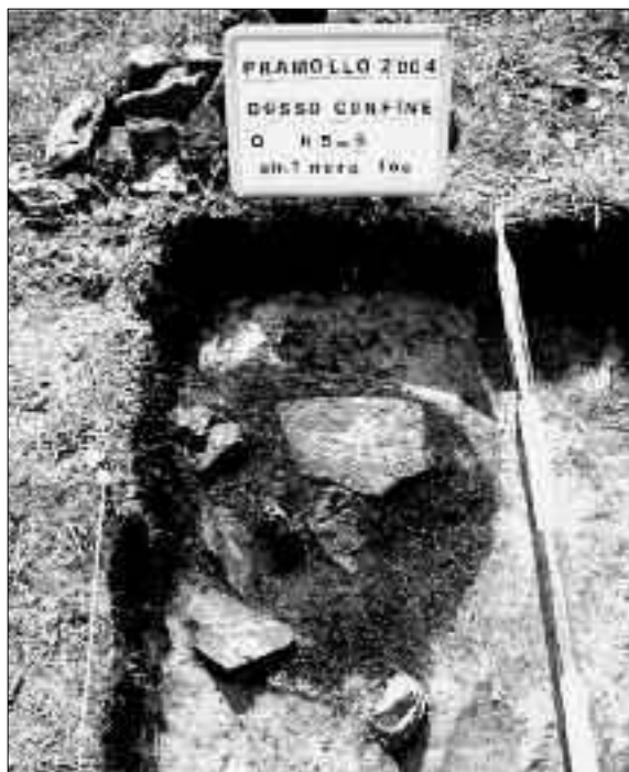
Fig. 12. Focolare di età romana presso il passo di Pramollo (da PESSINA 2006, p. 237).

del confine con l’Austria, sono state portate alla luce le tracce consistenti e distribuite su un vasto areale di una intensa frequentazione della zona da parte di cacciatori e pastori fin da epoche preistoriche, per giungere all’età romana (fig. 12) e oltre. Sul confine si è trovata traccia di strutture stabili, probabilmente ad uso stagionale, e i diversi indizi raccolti sembrano parlare a favore dell’esistenza di una continuità culturale tra i due versanti montani 60 , un tema che, come si è visto, negli ultimi anni ha esercitato una crescente attrazione nei confronti degli studiosi e che potrebbe trovare in questi territori sviluppi interessanti.