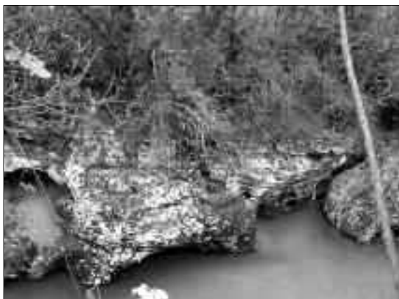
Fig. 10. Tracce del ponte sul Natisone presso la chiesa di S.Quirino.

chiaramente rilevabile, della coesistenza e convivenza, in particolare in epoca tardoantica, di comunità etnicamente e culturalmente distinte nello stesso territorio, con gli inevitabili proble-