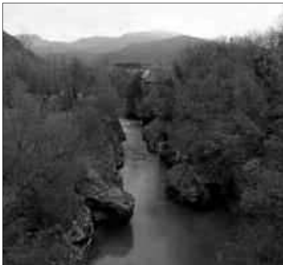
Fig. 9. La forra del Natisone presso la chiesa di S.Quirino.

chiaramente rilevabile, della coesistenza e convivenza, in particolare in epoca tardoantica, di comunità etnicamente e culturalmente distinte nello stesso territorio, con gli inevitabili proble-