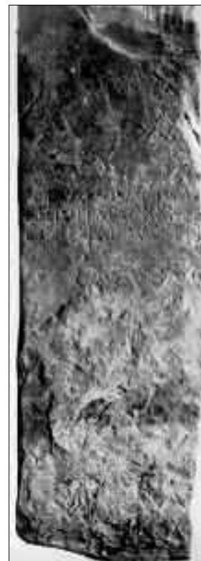
Fig. 4. Cippo con iscrizione relativa alla realizzazione di un raccordo stradale tra la via Postumia e il forum pequarium di Aquileia (da DEGRASSI 1965, p. 151).

Fin dalla metà dell'Ottocento, da quando cioè fu rinvenuto ad Aquileia un cippo iscritto (fig. 4) nel quale si ricordava la creazione di un raccordo tra la via Postumia e il foro pecuario della città, attestando così inequivocabilmente che