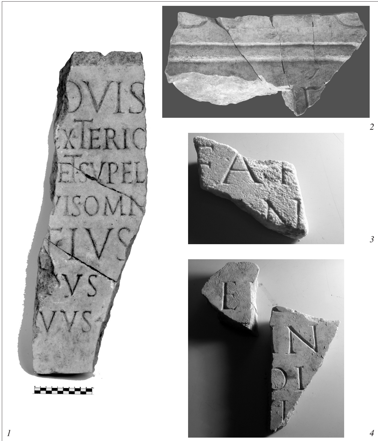
Fig. 1 - Frammento di lastra di marmo menzionante Giove (AFSBV). Fig. 2 - Frammento di aretta mutila con tracce di iscrizione (AFSBV). Fig. 3 - Frammento interno di tabella iscritta (AFSBV). Fig. 4 - Frammento interno di tabella iscritta (AFSBV).