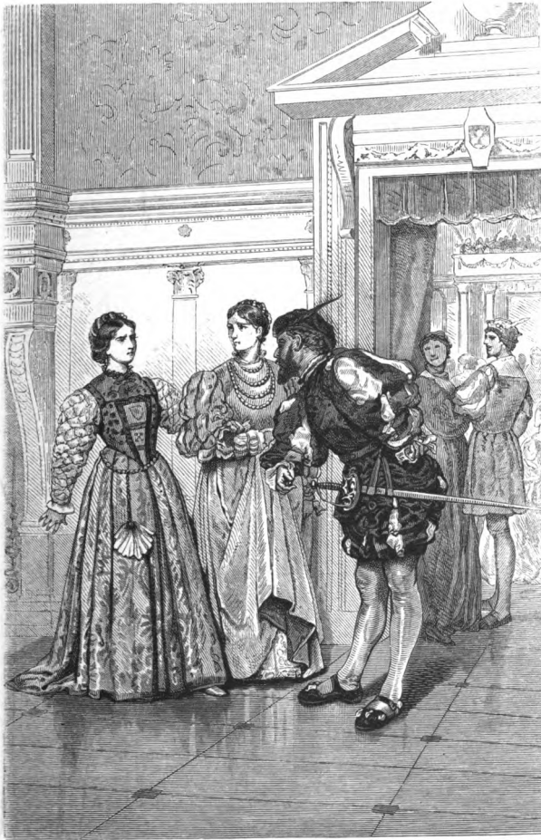
La figlia di Silvestro Aldobrandini ricusa di ballare con Maramaldo. Quadro di Eleuterio Pagliano.