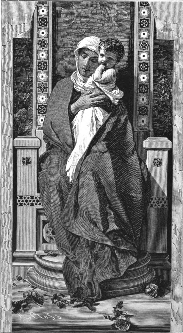
Salve Regina di D. Morelli.