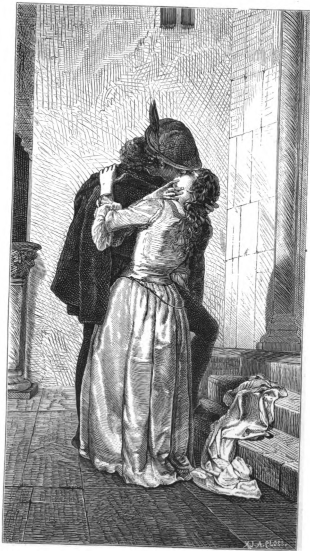
Il bacio di F. Hayez.