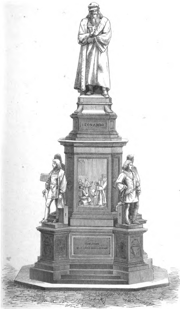
Leonardo da Vinci di P. Magni.