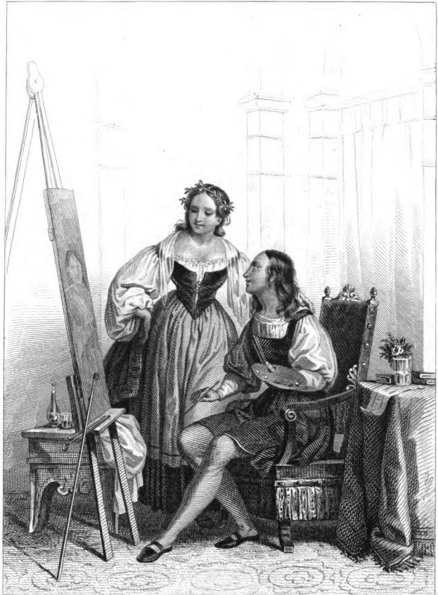
Schiavoni Felice pinx.